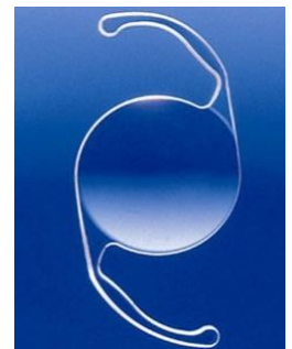
眼内レンズ例 6 mm×13 mm